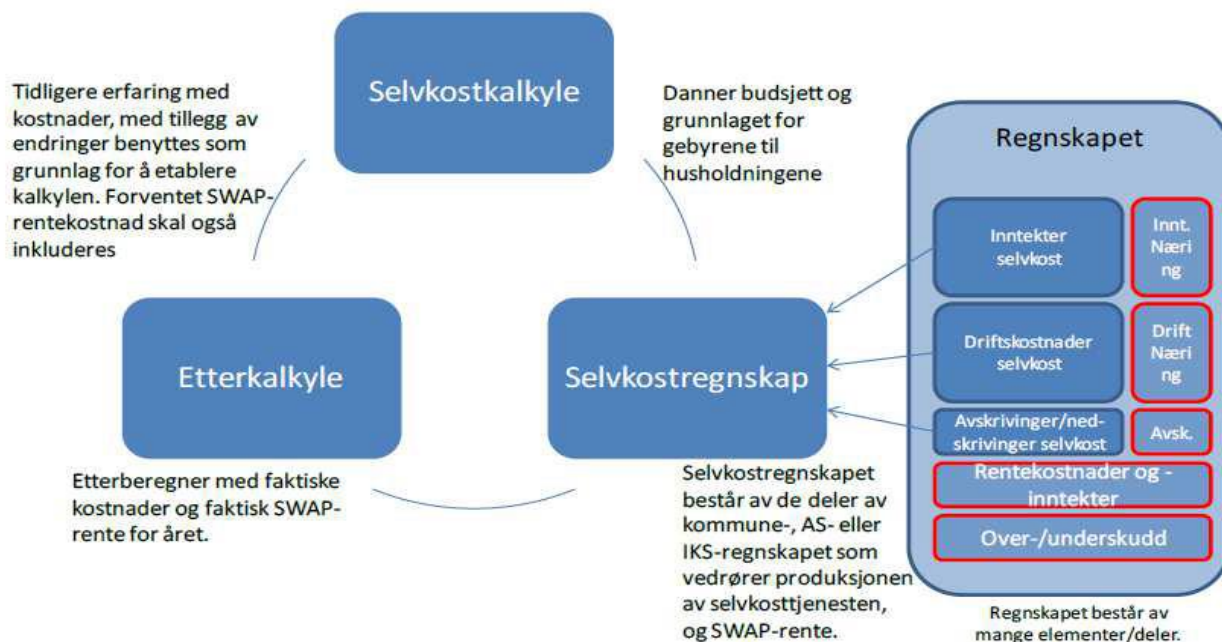
Figur 1: Sammenhengen mellom selvkostkalkyle, selvkostregnskap og etterkalkyle. 6

Proessen rundt selvkostkalkyle, selvkostregnskap og etterkalkylen kan beskrives som et årshjul som vist i figur nedenfor. Selvkostkalkylen danner grunnlaget for budsjett og selvkostgebyret til husholdningene. Etterkalkylen skal vise inntekter, kostnader og justeringer av selvkostfondet. I tillegg skal etterkalkylen inneholde etterberegninger av de faktiske kostnadene samt inkludere swap-rente.