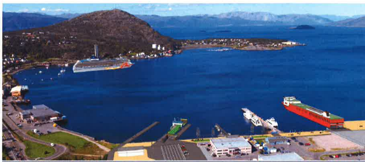
Figur 1. Fremtidige kaianlegg i Alta indre havn - Bukta